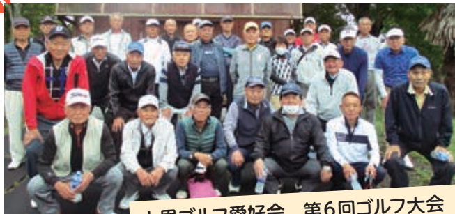
大里ゴルフ愛好会 第6回ゴルフ大会 5月12日(月) 大麻生ゴルフ場