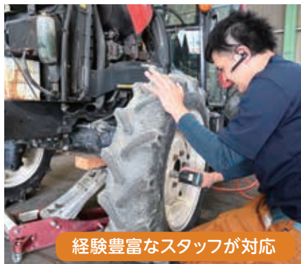
経験豊富なスタッフが対応