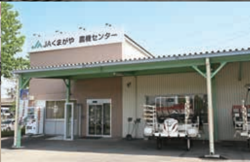
▲国道407号沿いに店舗を構える農機センター。