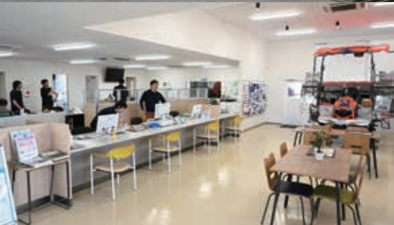
▲令和3年2月に事務所をリニューアル。明るい雰囲気の店内です。