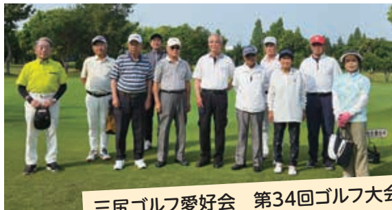
三尻ゴルフ愛好会 第34回ゴルフ大会 5月21日(火) 大麻生ゴルフ場