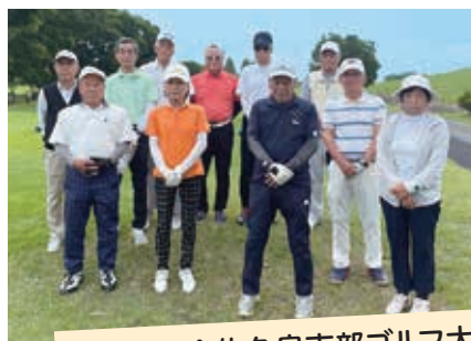
ゆうゆう会佐久良支部ゴルフ大会 5月27日(火) 吉見ゴルフ場