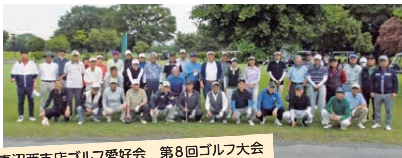
妻沼西支店ゴルフ愛好会 第8回ゴルフ大会 5月23日(金) 上里ゴルフ場