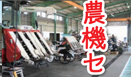
▲広々とした整備工場で作業を行っています。