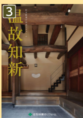
旧家リフォーム 事例集