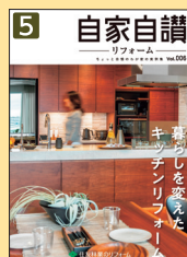
自家自讃 リフォーム Vol.6