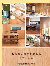
戸建てリフォーム 総合カタログ