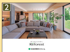
Reforest 商品コンセプトカタログ