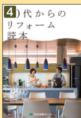
50代からの リフォーム読本